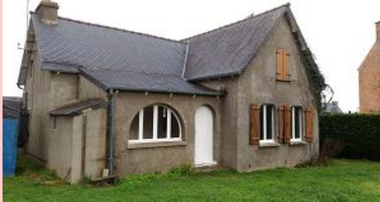
L'ancienne gendarmerie qui doit être remplacée par des logements à louer